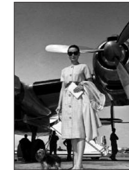
FV00067896 16 giugno 1958. Un'elegantissima Audrey in partenza dall'aeroporto di Ciampino dopo un incontro con i giornalisti.