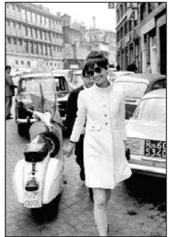
camerap_01527156 AUDREY HEPBURN - A passeggio per via Bissolati, Roma - 1968 (IMMAGINE LOCANDINA)