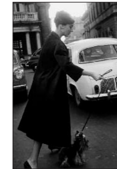
D278-49 7 febbraio 1960. Audrey all'uscita dell'- Hotel Hassler a Trinità dei Monti