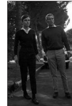
1538 - 02 AUDREY HEPBURN E PETER FINCH NEI GIARDINI DI CINECITTÀ - 1960