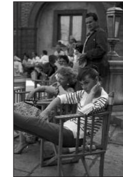
1927 - 23 AUDREY HEPBURN SUL SET DEL FILM "GUERRA E PACE" - 1955