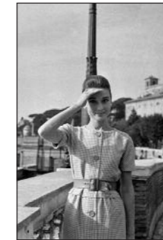
D278-40 1959. Audrey a Trinità dei Monti. Sullo sfondo, Villa Medici, sede dell'Ac- cademia di Francia.