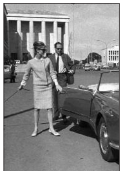
2931 - 02 AUDREY HEPBURN CON IL MARITO MEL FERRER - L'Eur, Roma - 1961