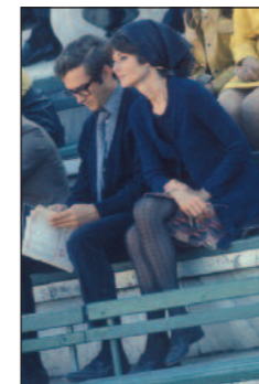
PML_V30110622MERAS723_001 AUDREY HEPBURN E IL MARITO AN- DREA DOTTI - 1970