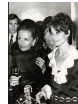
147-2 1971. Audrey Hepburn con Irene Galit- zine all'inaugurazione del suo atelier in via Veneto.