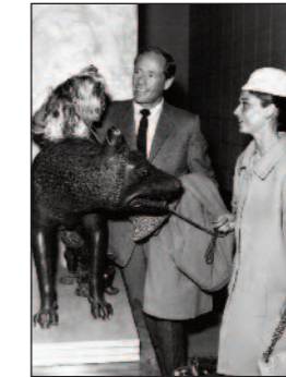
PMI_V30090217FHSAS207_001 AUDREY HEPBURN E MEL FERRER - Musei Capitolini, Roma - 1958