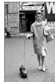
camerap_01527266 Audrey Hepburn a passeggio con il suo cane "Famous" - 1961