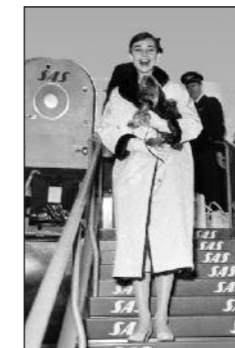
PMI_Z3000S001149_029 AUDREY HEPBURN ARRIVA A CIAM- PINO - 1958