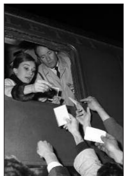
FV00098745 5 marzo 1960. Audrey e Mel Ferrer alla Stazione Termini, in partenza per la Svizzera, firmano autografi dal finestrino del treno