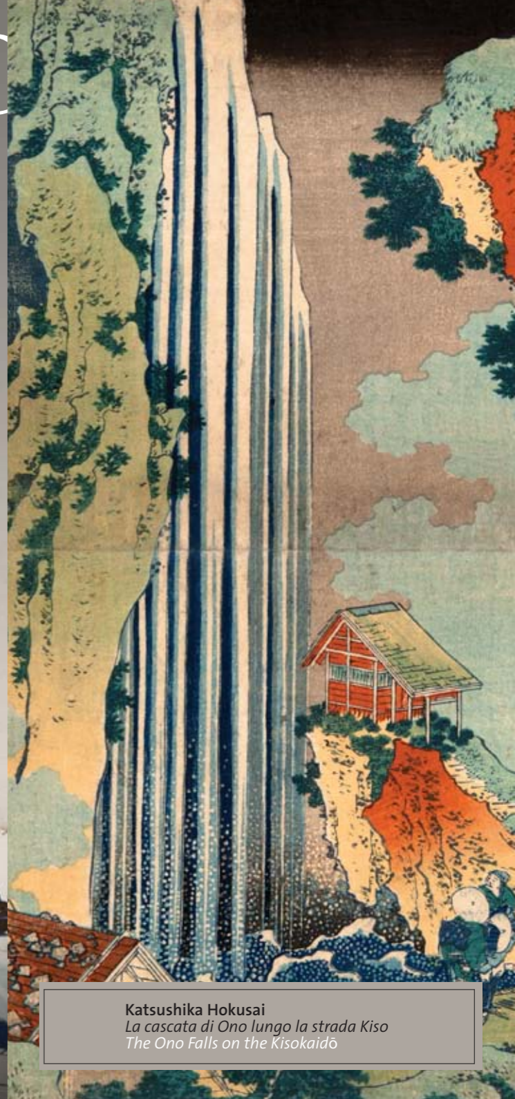
Katsushika Hokusai La cascata di Ono lungo la strada Kiso The Ono Falls on the Kisokaidō